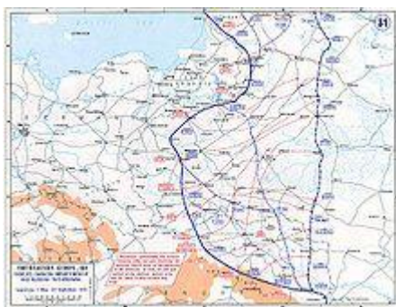
Прорыв русского фронта, лето 1915

Зимняя операция в Карпатах. 9-11 февраля австро-германские войска начали наступление в Карпатах (см.: Карпатская операция ), особенно сильно нажимая на наиболее слабую часть русского фронта на юге, в Буковине . В то же время русская армия начала встречное наступление, рассчитывая перейти Карпаты и вторгнуться в Венгрию с севера на юг. В северной части Карпат, ближе к Кракову, силы противников оказались равными, и фронт за время боёв в феврале и марте практически не сдвинулся, оставшись в предгорьях Карпат с русской стороны. Но на юге Карпат русская армия не успела сгруппироваться, и концу марта русскими была потеряна большая часть Буковины с Черновцами . 22 марта пала осаждённая австрийская крепость Перемышль , сдалось более 120 тыс. человек. Взятие Перемышля стало последним крупным успехом русской армии в 1915 году.